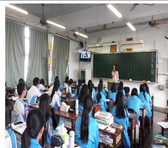
活動說明：導師與同學討論中