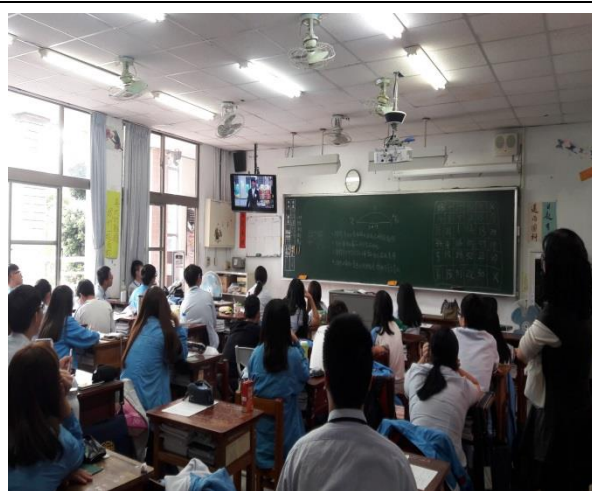
活動說明：師生觀賞影片中

運用班會時間播放 106 年度「反毒宣導」微電影得獎的作品，讓同學觀賞從同學自己角度演出的觀點，更了解毒品的它接觸的時機與危害，進而自我保護，接著由導師與同學互動，用案例宣導強化防毒的重要性，並由同學書寫心得單，加深印象。