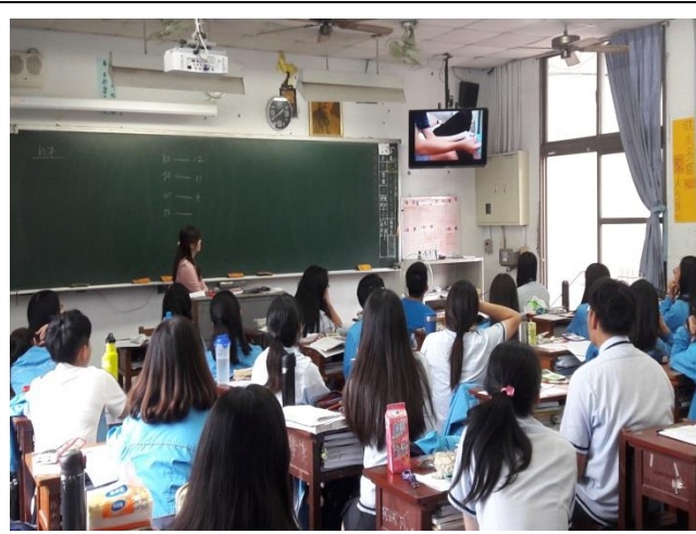
活動說明：師生觀賞影片中